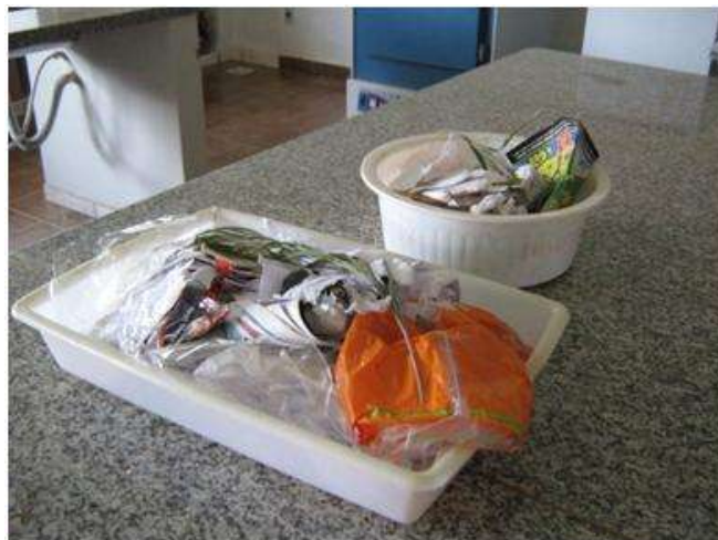
Figura 5 – Amostra de resíduos levada à estufa para obtenção do teor de umidade

Para a coleta do teor de umidade, as amostras dos resíduos foram colocadas em dois vasilhames e cobertos com papel furado e depois levados para estufa onde permaneceram em uma temperatura de 50°C durante 24 horas de acordo com as Figuras 5 e 6.