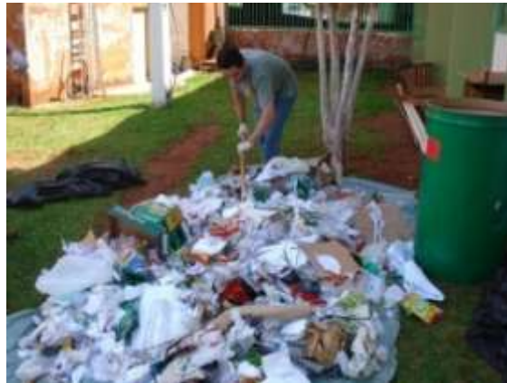
Figura 2 – Homogeneização da pilha de resíduo

Uma vez realizada a homogeneização da amostra a ser estudada, foram iniciados os ensaios, visando à coleta dos dados necessários para a pesquisa. Segundo IPT (2000), para determinação da caracterização física é necessária a análise dos seguintes aspectos: composição gravimétrica, teor de umidade e material seco, geração per capita e densidade aparente.