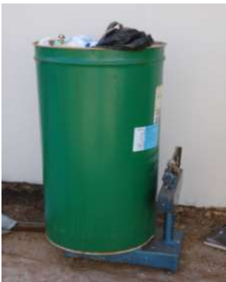
Figura 8 – Pesagem do material para determinação da densidade aparente

A densidade aparente, no contexto de um Programa de Gerenciamento de Resíduos Sólidos, é uma variável importante, pois possibilita determinar os meios de armazenamento, coleta, tratamento e disposição final dos resíduos.