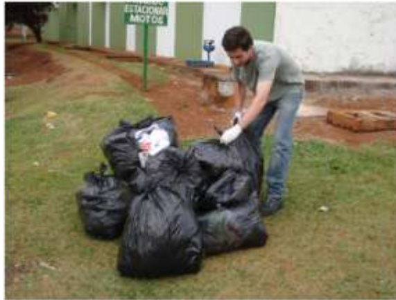
Figura 1 - Amostra de resíduos a ser caracterizada