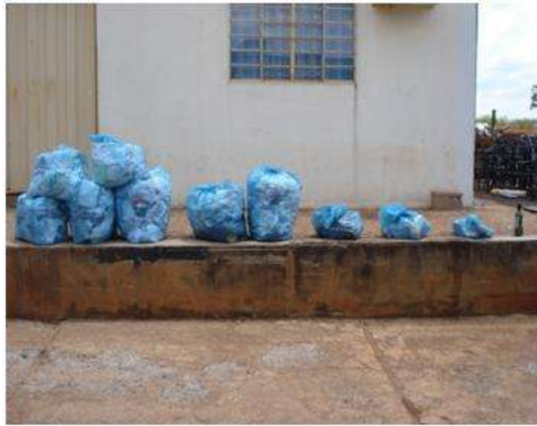
Figura 3 – Materiais separados

Os resíduos foram separados nas seguintes categorias: papel, plástico, Matéria Orgânica (MO), material longa vida, metal e vidro, colocados e pesados separadamente dentro de sacos como mostram as Figuras 3 e 4.