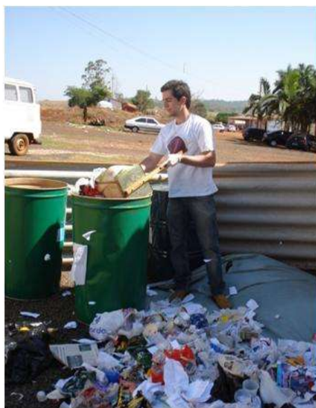
Figura 7 – Determinação do volume do resíduo