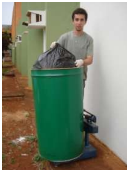
Figura 4 – Pesagem dos materiais segregados