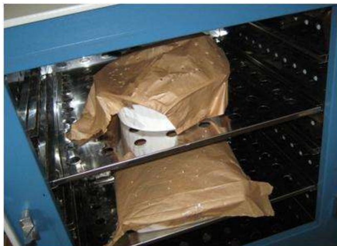
Figura 6 – Estufa utilizada para determinação do teor de umidade

O teor de umidade é um aspecto relevante para a implantação de um programa de gerenciamento de resíduos, no que se refere à escolha do tipo de recipiente para o acondicionamento/armazenamento temporário dos resíduos, bem como de uma previsão da possível geração de percolato durante este período de armazenamento provisório até a sua destinação final. Por fim, o mesmo também interfere na qualidade do material, caso seja alvo de um processo de segregação para reciclagem (ex: papel, papelão).