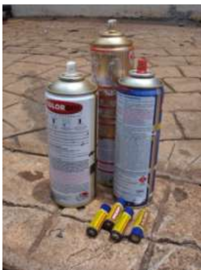
Figura 9 – Resíduos perigosos

Em tempo, foram identificados alguns resíduos Classe I (latas de tinta spray e pilhas) em meio aos demais materiais estudados, como pode ser visualizado na Figura 9.